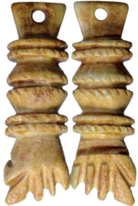
Figa BPLX - CDL 3