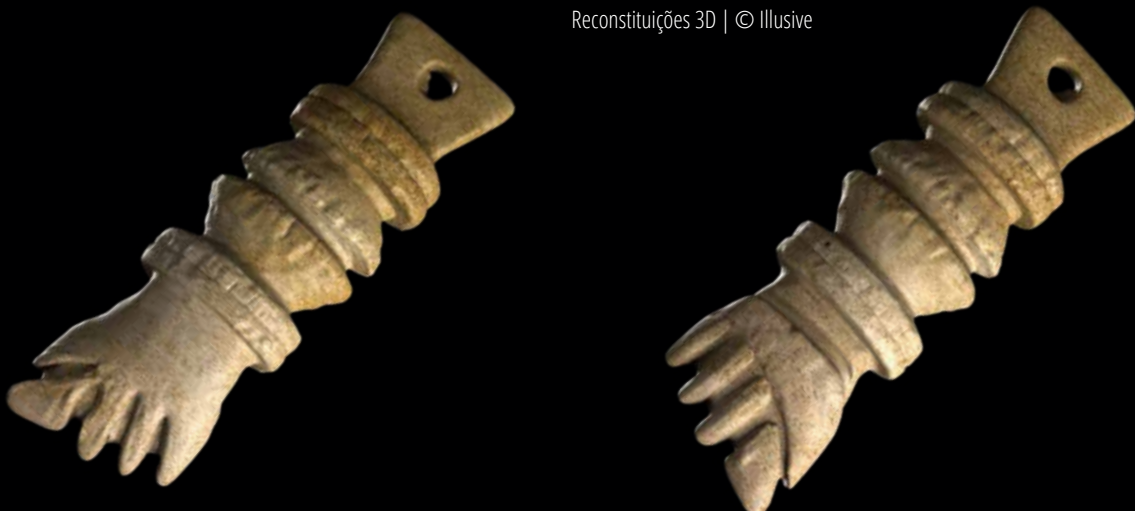
Reconstituições 3D | © Illusive

Com o passar dos tempos e a sua expansão a novas culturas, o significado da figa evoluiu de formas divergentes. Se por um lado, hoje pode ser associado à proteção contra o mau-olhado e outros malefícios em geral, como nos casos das culturas afro-brasileira e portuguesa, por outro, a manutenção da sua carga sexual intrínseca redundou numa apreciação negativa e pejorativa, como é o caso de várias regiões da Europa mediterrânica.