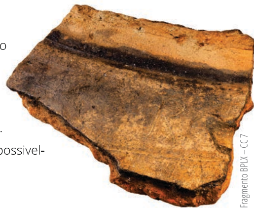
Fragmento BPLX – CC7

Este fragmento pertencia a um dolium cuja utilização terá ocorrido possivelmente entre os séculos I e III d.C.