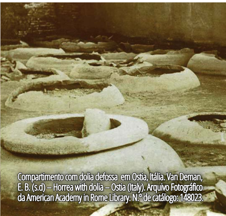
Compartimento com dolia defossa em Ostia, Itália. Van Deman, E. B. (s.d) – Horrea with dolia – Ostia (Italy). Arquivo Fotográfico da American Academy in Rome Library. N.º de catálogo: 148023.