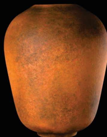
Reconstituições 3D