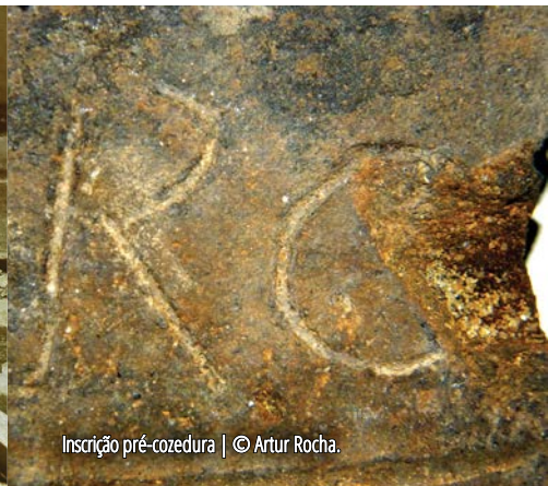
Inscrição pré-cozedura | © Artur Rocha.