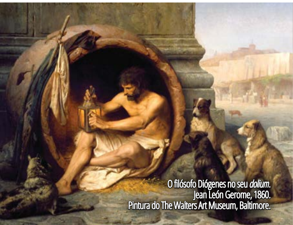
O filósofo Diógenes no seu dolium . Jean León Gerome, 1860. Pintura do The Walters Art Museum, Baltimore.

No seu tratado sobre arquitetura, Vitruvius indica uma outra função para os dolia que, no entanto, terá sido residual: a de elementos de ressonância em pequenos teatros onde, por falta de meios financeiros, não se conseguiam colocar os exemplares em metal habitualmente utilizados para desempenhar essa função.